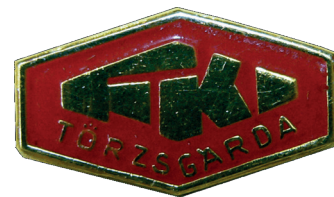
A VASKUT egykori cégtáblája és az FKI törzsgárdatagi jelvénye

Az elmúlt évtizedekben egyébként számos alkalommal adott hírt a szakmai sajtó az intézmények valódi jubileumairól. Ezekből a cikkekből álljon itt néhány példa: a valódi jubileumokról szóló cikkek címei magukért beszélnek.