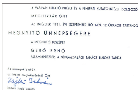
Meghívó a VASKUT és az FKI megnyitó ünnepségére